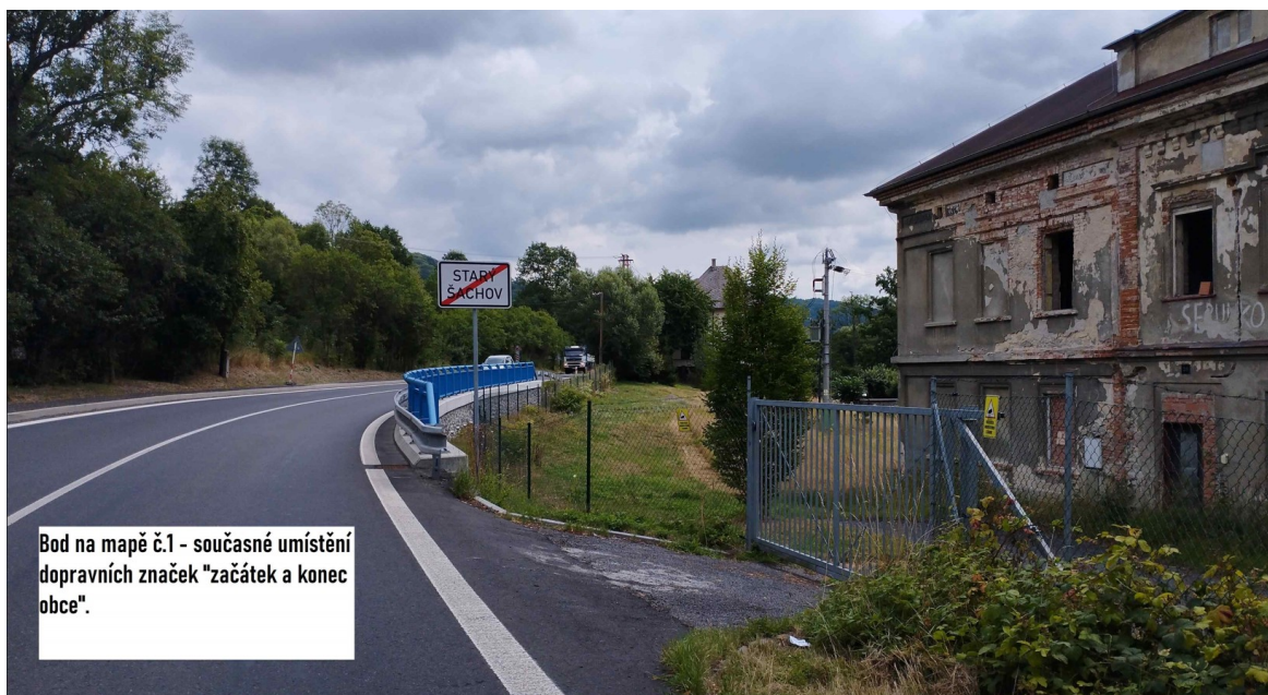
Bod na mapě č.1 - současné umístění dopravních značek "začátek a konec obce".